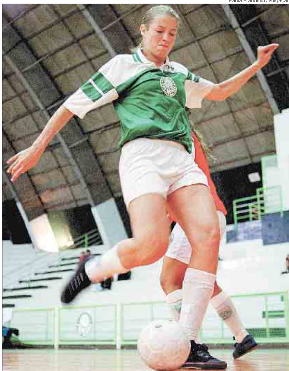
Boleira - Luana Piovani, torcedora do Palmeiras em 'O Casamento de Romeu & Julieta'