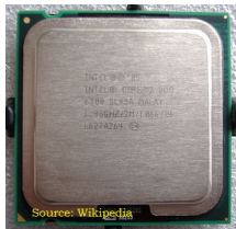
Intel Core 2 Duo