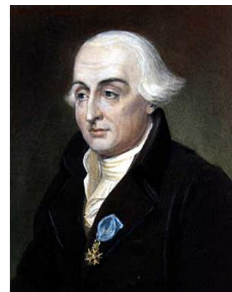
Joseph Louis Lagrange (1736–1813)

O método funciona igualmente quando temos uma função de 3 variáveis reais f(x, y, z) e uma restrição g(x, y, z) = k .