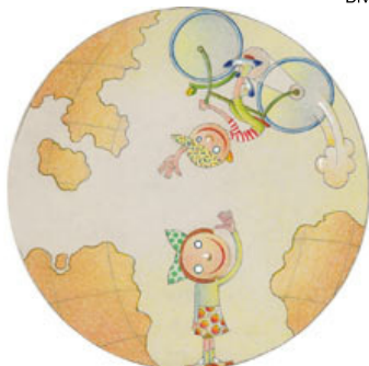
Imagem de "O Livro Redondo", de Caulos