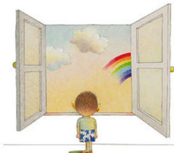
Imagem de "O Livro Quadrado", de Caulos

Pesquisas recentes mostram que alunos dos ensinos fundamental e médio não vão nada bem em matemática.