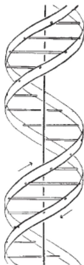
This figure is purely diagrammatic. The two ribbons symbolize the two phosphate—sugar chains, and the horizontal rods the pairs of bases holding the chains together. The vertical line marks the fibre axis

Another three-chain structure has also been suggested by Fraser (in the press). In his model the phosphates are on the outside and the bases on the inside, linked together by hydrogen bonds. This structure as described is rather ill-defined, and for this reason we shall not comment on it.